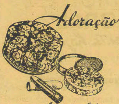
uma combinação feliz