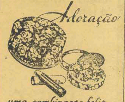
uma combinação feliz

O Tribunal deu, em parte, provimento á apelação para condenar o apelante no grau médio da art. 157 da Consolidação das Leis Penais e a 500$000 de taxa penitenciaria.