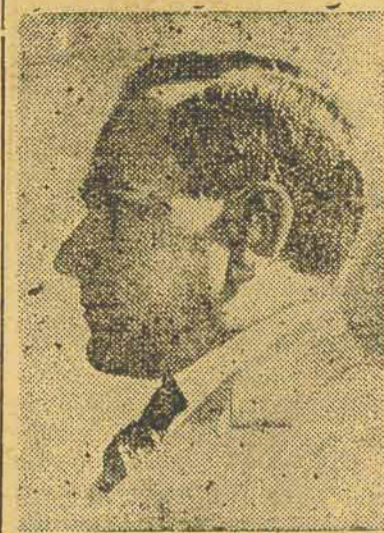
Pres. Getulio Vargas

O SR. GETULIO VARGAS IRA FAZ RIO GRANDE EM FINS DESTE MES OU EM PRINCIPIOS DE ABRIL