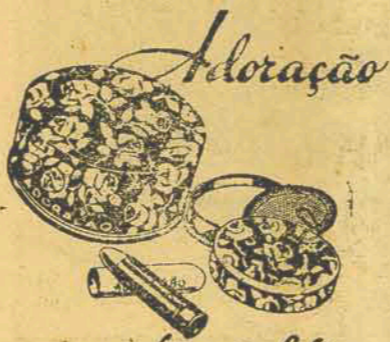
uma combinação feliz