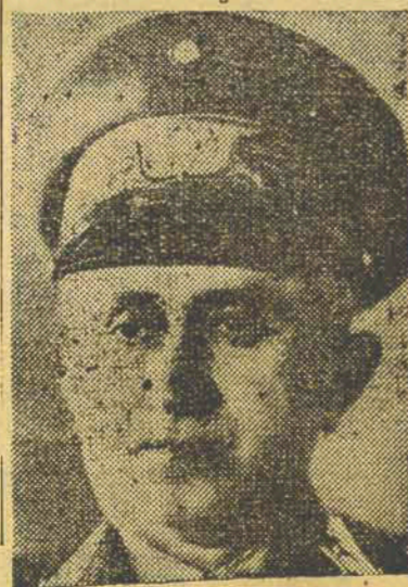
Gal. Gaspar Dutra

RIO, 6—Esteve hoje no gabinete do ministro da Guerra, em demorada conferencia com o general Gaspar Dutra, o capitão Felinto Muller, chefe de policia.