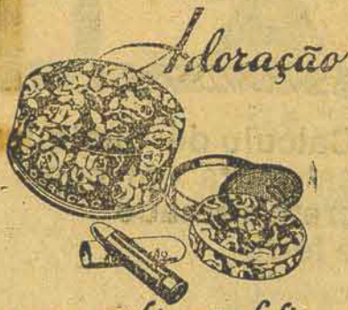
uma combinação feliz

RUA CONSELHEIRO MAFRA, 34 — Florianopolis