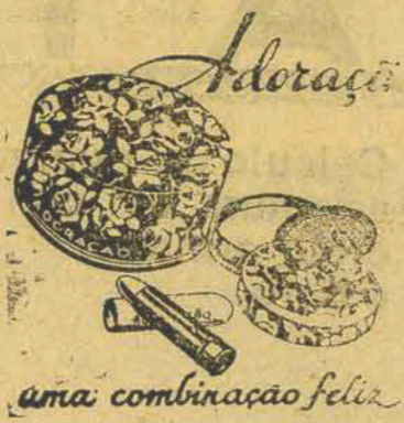
uma combinação feliz

REABERTURA DE AULAS: Curso Preliminar e Jardim da Infância —16 de fevereiro Curso Normal, Sup. Vocacional e de Admissão—1º de março Curso Ginásial —16 de março EXAMES DE ADMISSÃO —24 de fevereiro EXAMES DE 2a. EPOCA: Escola Normal—24 de fevereiro Ginásio —10 de março MATRICULA—na quinzena precedente à abertura dos respectivos cursos das 9 às 12 e das 15 às 18 horas.