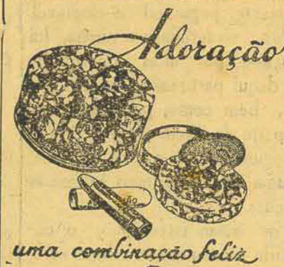
uma combinação feliz

A 30 de Janeiro ultimo, o es- critor formou num grupo que ia ser fuzilado, tendo se salvo mi- lagrosamente porquanto logrou ocultar-se logo depois da primei- ra descarga. Chegou o sr. San- chez Maza na vespera do Dia do Estudante Caído em cuja honra compôs a oração aos mortos em combate, que é sempre repetida oficialmente junto aos tumulos em homenagem aos que morre- ram por Deus, na Espanha.