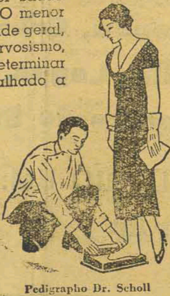
Pedigrapho Dr. Scholl

Visite-nos e sem custo ou qualquer compromisso de sua parte, lhe demonstraremos como se pode alliviar e supprimir rapidamente os sofrimentos ou qualquer incommodo de seus pés.