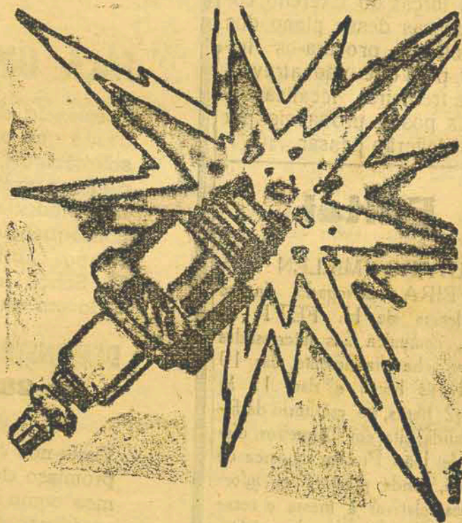
De Fama Mundial!