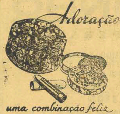
uma combinação feliz

BERLIM, 24 - A embaixada dos Estados Unidos enviou, ontem, ao Ministerio das Relações Exteriores uma nota, em que expressa a esperança de que os cidadãos norte americanos não sejam afetados pelo recente decreto eliminando todos os elementos hebraicos de profissão dentista, residentes na Alemanha.