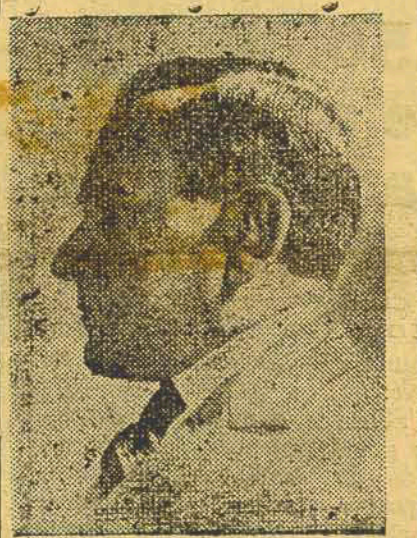
Presidente Getulio Vargas

IRA A PORTO ALEGRE EM PRINCIPIOS DE MARÇO