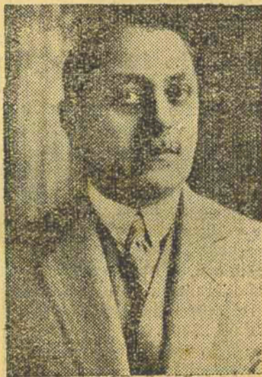
EMBAIXADOR MACEDO SOARES

S. PAULO, 26 — Acha-se quasi restabelecido da enfermidade que o deteve ao leito varios dias, o embaixador Macedo Soares. No dia 27 de janeiro corrente, o Embaixador Macedo Soares discursará em Santos, por ocasião dos festejos centenários daquela cidade.