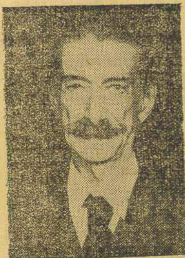
DR. BORGES DE MEDEIROS

PORTO ALEGRE, 12—Está sendo esperado nesta capital o sr. dr. Borges de Medeiros, que se fará acompanhar de sua esposa e aqui se demorará vários dias.