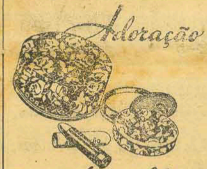
uma combinação feliz

A Secretaria da Escola de Comercio de Santa Catarina, solicita-nos tornas publico que, diariamente, das 17 as 19 horas, fará entrega dos competentes certificados, aos alunos que foram promovidos a série seguinte, ou aos que concluíram o Curso Propedeutico.