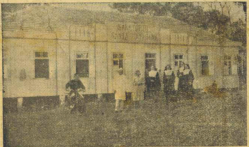
Sanatorio Santa Catarina

Otimamente instalado no alto de uma colina o Sanatorio Santa Catarina, conquistou a preferéncia e confiança dos habitantes do oeste catarinense, não só por contar essa casa de saúde com os aparelhos mais modernos de cirurgia, como ainda pela competencia profissional do seu dirigente, pelo conforto ali desfrutado e pelo lhano tratamento que é dispensado aos que sofrem.