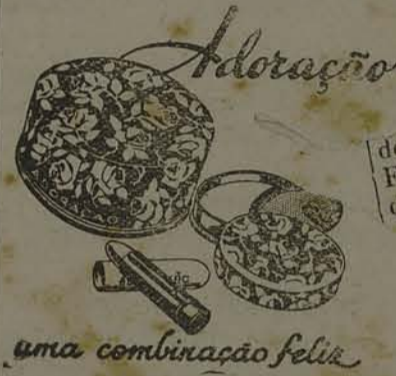
uma combinação feliz

RIO, 29 O presidente da Republica assinou decreto, na pasta da Guerra declarando que a transferencia para a reserva do Exército do general de divisão Firmino Antonio Borba se enquadra no disposto no artigo 1.º do decreto-lei numero 679, de 12 de setembro de 1938, que altera a idade limite para a permanencia dos oficiais no Exército ativo.