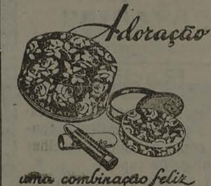
uma combinação feliz