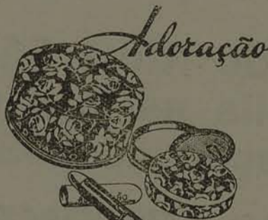
uma combinação feliz

Ninguém ha que possa quebrar a "Combinação Feliz". Sempre unidos caminham os imprescindíveis companheiros da Mulher Brasileira:—PO' DE ARROZ, BATON E ROUGE "Adoração"