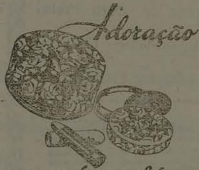
uma combinação feliz