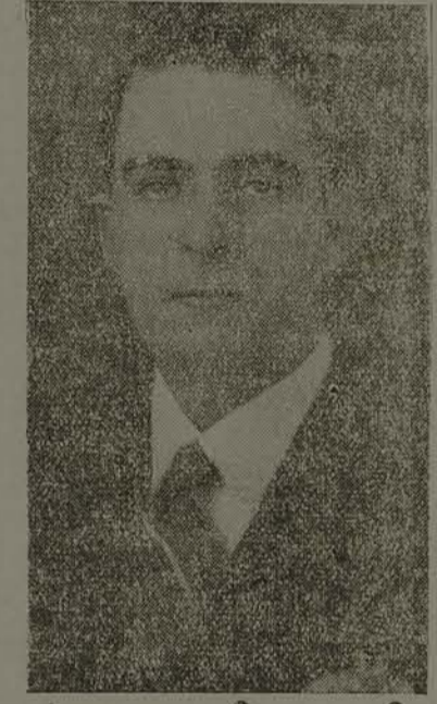
Prefeito Mauro Ramos