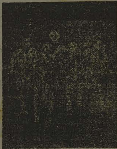
Enio, Leoni e Irmãos, residentes em Itacorobi, contemplados com o premio maior no valor de Rs. 5:500$000, no sorteio de 4-6-1938.