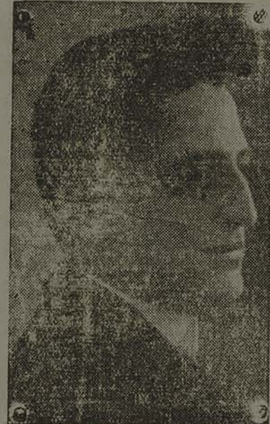
Des. Gil Costa

Trechos da brilhante conferencia realizada á noite passada, pelo ilustre desembargador Gil Costa, na Faculdade de Direito, promovida pelo Centro Academico XI de Fevereiro: «O decreto-lei que regula a nacionalidade brasileira e a naturalização dos estrangeiros honra ao presidente da Republica. Honra á legislação do Estado-Novo, e honra ao regime no seu desasombro, na sua sabedoria e na sua visão de brasilidade. A sua letra e o seu espirito são diretrizes que correspondem ás aspirações cabólicas do Brasil e se conformam com a sua dignidade de expressão de um povo livre».