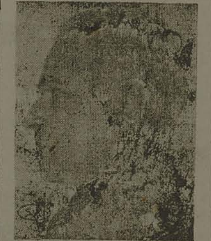
Pres. Getulio Vargas

RIO, 6 — «O Globo», na sua ultima edição de hoje, publica: —«De fonte absolutamente segura, sabemos que ainda hoje ou amanhã o ambaxador Nobre de Melo irá ao Catete, afim de convidar o sr. Getulio Vargas, em nome do governo português, a visitar Portugal no proximo ano. Por essa ocasião, aquele diplomata entregará ao chefe da Nação uma carta do general Carmona, em que o presidente da Republica Portuguesa faz o honroso convite. Tudo indica que o