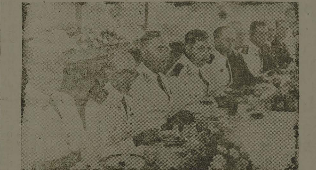
FLAGRANTE DO ALMOÇO

Decorreram brilhantissimas as comemorações recentemente realizadas no Rio de Janeiro, por ocasião da passagem do 130.º aniversario dos Dragões da Independencia, a tradicional unidade do Exército fundada em 1803. No Quartel da Avenida Pedro II foi levado a efeito um programa do qual se destacaram o almoço oferecido pelo comandante dos Dragões, cel. Aristoteles de Souza Dantas, e officialidade, aos ex-comandantes e a inauguração do retrato do general Eurico Dutra, ministro da Guerra, como homenagem por ter sido esse chefe militar, até agora, o único official subalterno que serviu no regimento e que, função a função, chegou a ministro da Guerra. Toda a officialidade assistiu á cerimonia inaugural, estando também presentes o general Góes Monteiro, Chefe do Estado Maior, comandante da 1.ª Região Militar, o ministro Ribeiro da Costa, ajudante de ordens do ministro da Guerra e sua exma. esposa.