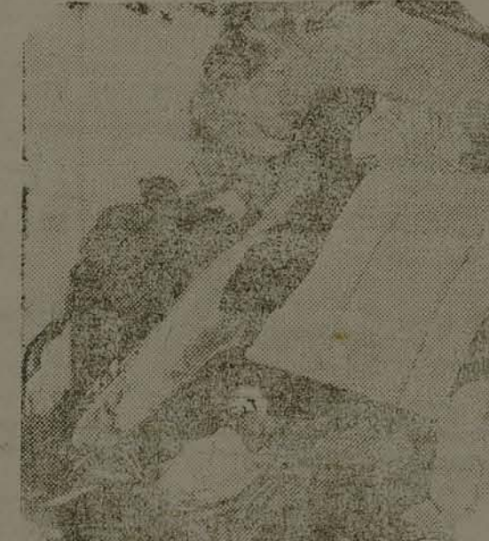
Os objetos roubados

noticia de que o advogado seria expulso do territorio nacional, para, logo a seguir, darem um assalto em fórma á residencia do mesmo.