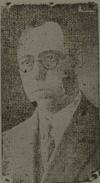
DR. NERÊU RAMOS, Interventor Federal neste Estado