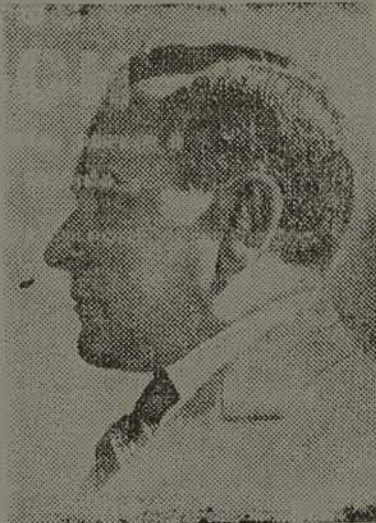
Dr. Getúlio Vargas, presidente da Republica

Sentindo na alma a resonancia daquela heroica proclamação eu vos asseguro que cumprirei o meu dever, seja a que preço for, e reafirmo perante vós o meu ardente desejo de ver a Marinha Brasileira acompanhar e impulsionar o fortalecimento da Nação, e com ela renovar, progredir e engrandecer».