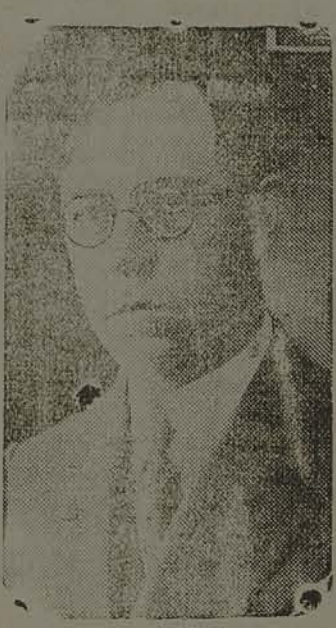
Dr. Nerêu Ramos

A inauguração deste retrato, que se revestirá de uma desusada imponência, vale como segurança da integração a