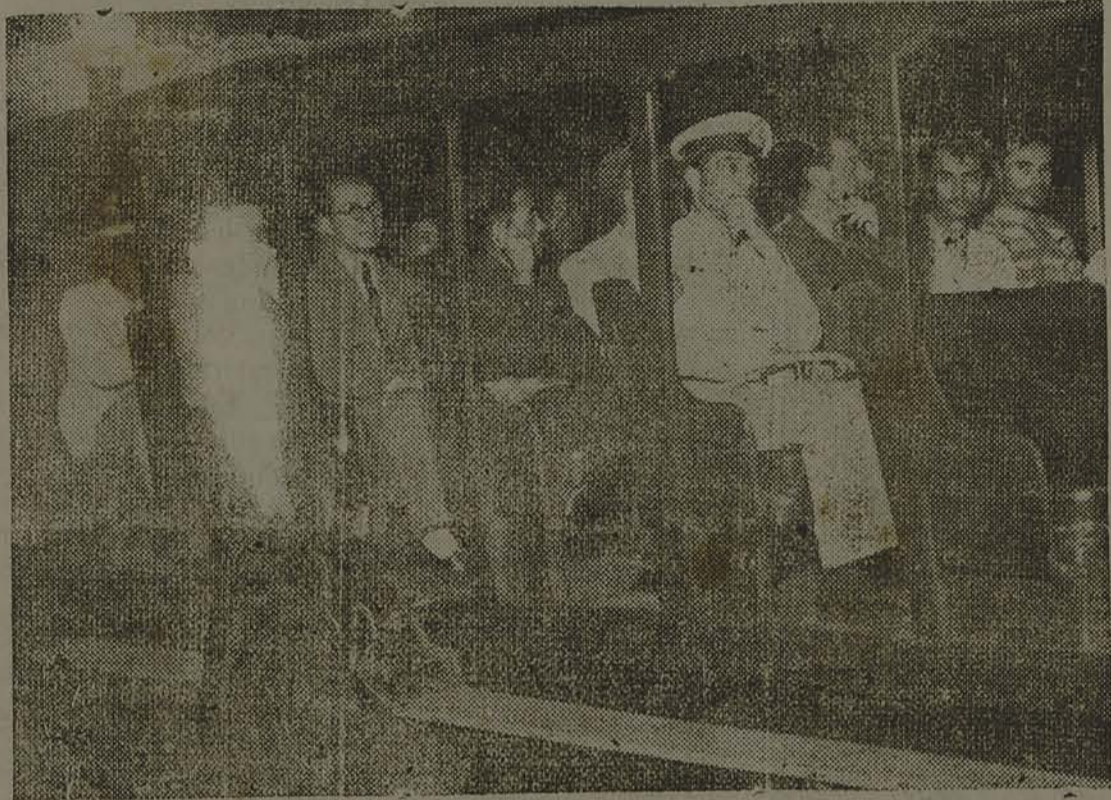
Civis e marinheiros, presos envolvidos no movimento integralista de maio último, a caminho da Ilha Grande.