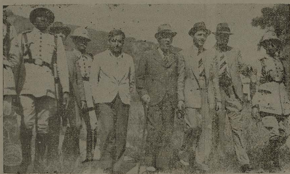
Flagrante apanhado quando da presença das autoridades na Leopoldina, afim de procederem a uma diligencia importante.