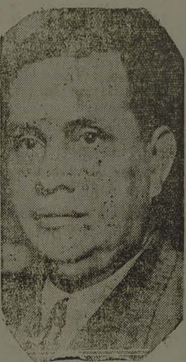
GAL. GÓES MONTEIRO

O gal. Góes Monteiro termina o seu discurso dizendo, que prefere levantar sua taça pela prosperidade do Brasil, porque sabe, perfeitamente, que são esses os votos de todos os jornalistas.