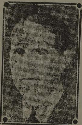
MINISTRO OSVALDO ARANHA

Interrogado sobre a anunciada Liga das Nações Americanas, respondeu o sr. Osvaldo Aranha que não percebia o lado pratico de tal liga.