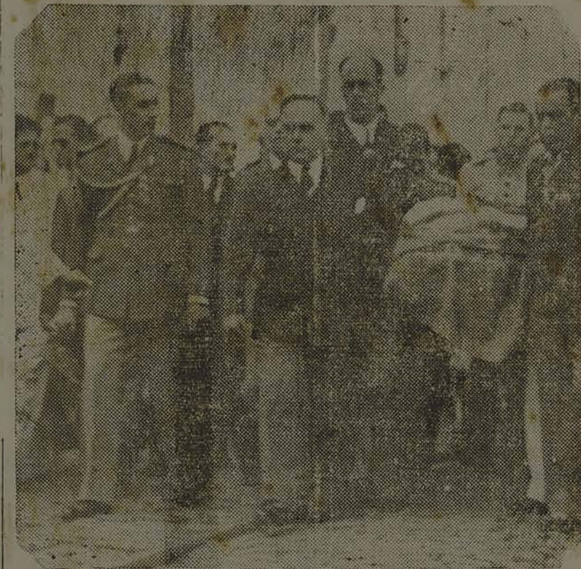
Um flagrante dos funerais do ilustre morto, vendo-se o Presidente Getulio Vargas a uma das alças do caixão

PALMEIRA, 4 — Causou profunda consternação nesta localidade, o falecimento do general Manoel Daltro Filho, interventor do Estado e comandante da 3a. Região Militar, em cujos postos deu tanta prova de capacidade, energia e patriotismo, reintegrando o Estado numa promissora fase de tranquilidade, desenvolvimento e moralidade.