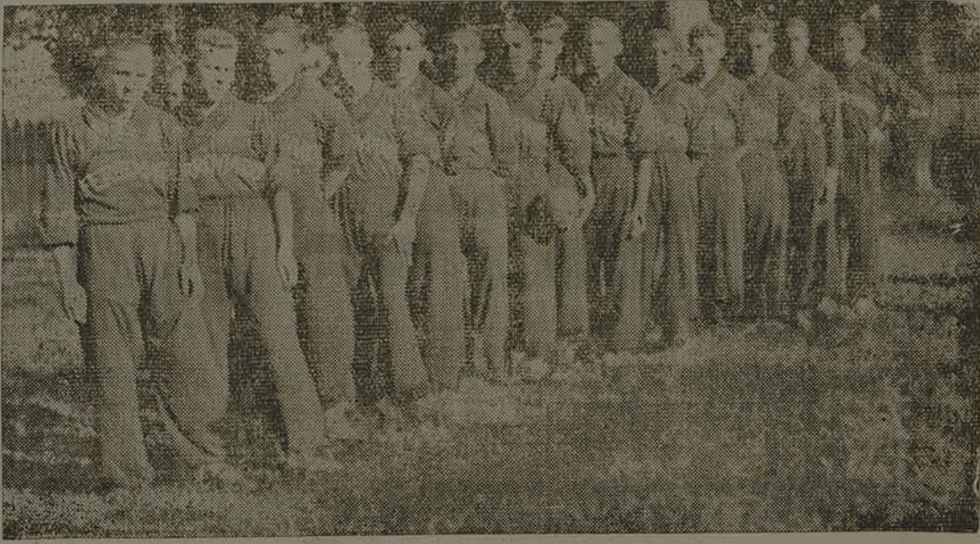
A valorosa equipe visitante

Chegou, ontem, a esta capital a brilhante comitiva do Ferrovário de Curitiba, que aqui vem disputar dois MATCHS de futebol.