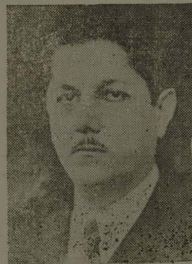
DR. BENEDITO VALADARES

RIO, 4 — Informações de Belo Horizonte anunciam que o sr. Benedito Valadares adiou a sua anunciada viagem ao Rio, tendo resolvido seguir para Poços de Caldas, onde se encontrará com o presidente Getulio Vargas.