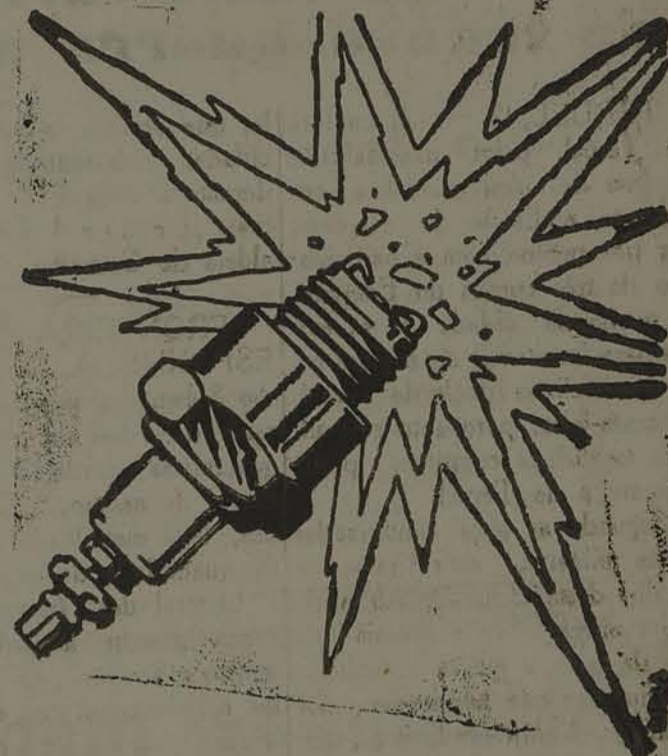
De Fama Mundial