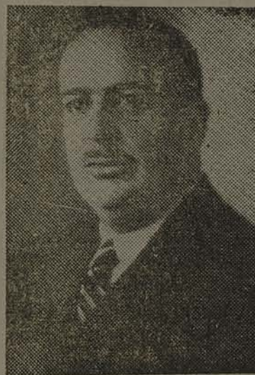
MINISTRO SOUZA COSTA

RIO, 5 (Especial)—O sr. Souza Costa, Ministro da Fazenda, convocou para hoje uma reunião de banqueiros, afim de com eles combinar as bases da nova lei bancaria.