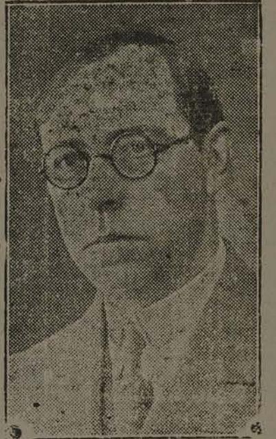
Dr. Nerêu Ramos, governador do Estado

Com o seu incontestável prestígio junto das altas autoridades da República, não descurou igualmente um só momento em tudo fazer para alcançar o desideratum que tanto vem realçar o nome catarinense, o nobre governador do Estado sr. dr. Nerêu Ramos, assinalando com esse grande marco, mais uma etapa brilhante do seu governo honrado e fecundo.