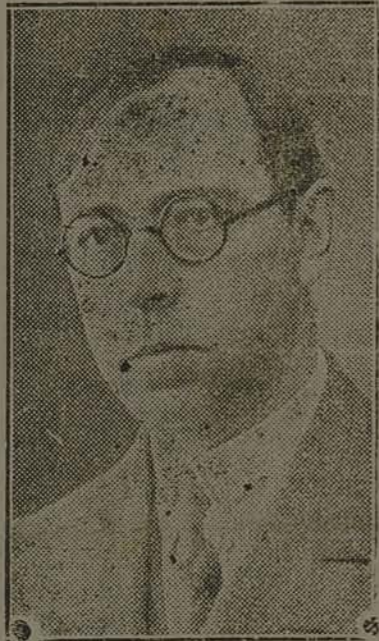
DR. NEREU RAMOS, Governador do Estado

Palácio do Governo em Florianópolis, 29 de Setembro de 1937.