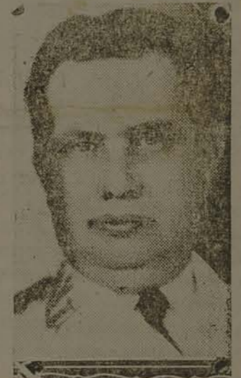
GAL. GÓES MONTEIRO

RIO, 30 O objetivo do informe do chefe do Estado Maior ao paiz é desautorizar as falsas noticias de que essa primeira autoridade do Exército está conspirando.