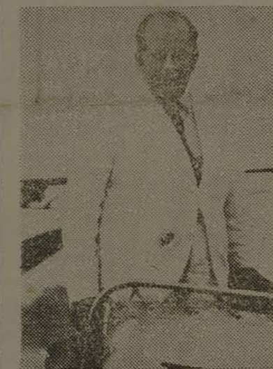
GOV. LIMA CAVALCANTI