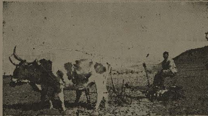
PREPARO DO TERRENO

COOPERATIVAS AGRICOLAS O Departamento de Propa-