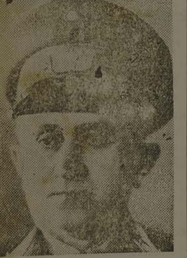
MINISTRO EURICO GASPARGASPAR DUTRA

RIO, 28 (Especial) — O general Eurico Gaspar Dutra, chegou ontem muito cedo ao seu Ministério. Momentos depois entravam no gabinete do Ministro, o capitão Felinto Mueler, chefe de policia e o general Góes Monteiro, chefe