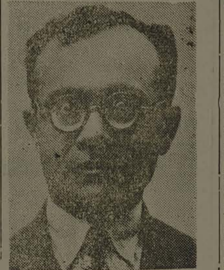
DR. JOSE AMERICO

RIO, 28 (Especial) — No comicio de sabado, em prol da candidatura do sr. José Américo, os punguistas entraram em ação, sendo as maiores vitimas alguns deputados e senadores. A policia conseguiu deitar a mão a 7 desses «cavalheiros de industria».