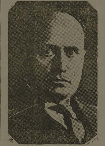
SR. BENITO MUSSOLINI

Calcula-se em um milhão nas imediações da estação. O serviço de vigilancia foi feito por 50 mil policiaes. Julga-se ser esta a maior recepção que a historia de Berlim registra.