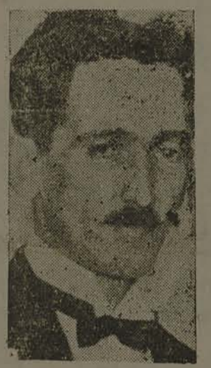
SR. PLINIO SALGADO

RIO, 28 (Especial) — O gravissimo conflito registrado no bairro de Anchieta, por ocasião do comicio ali levado a efeito em prol da candidatura do sr. José Américo, abalou profundamente a população carioca, tanto mais, não oferecer a menor dúvida de caberem todas as responsabilidades aos adeptos do sr. Plinio Salgado.