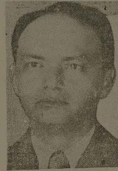
MINISTRO ACAMENON MAGALHÃES

RIO, 27 (Band) O padre Arruda Camara proferiu um discurso durante a sessão da Assembléa Legislativa, atacando a administração do Estado de Pernambuco e acusando o governador Lima Cavalcanti de haver traído o sr. Getulio Vargas e depois o sr. Agamenon Magalhães e o Estado de S. Paulo, para se comprometer, finalmente, com a candidatura José Américo. A oração do padre Arruda Camara provocou energicos protestos da bancada situacionista pernambucana.