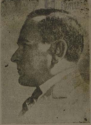
Pres. Getulio Vargas