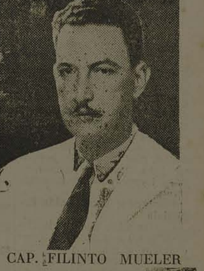
CAP. FILINTO MUELER

RIO, 29 (Especial) — O capitão Filinto Mueler, falando aos jornais, declarou que agirá com a mais vigorosa energia contra os responsaveis pelos tragicos acontecimentos de Anchieta, de molde a que não fiquem impunes,