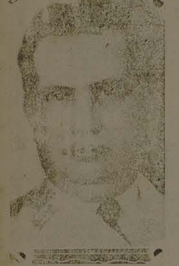
Gal. Góes Monteiro

cito dos meios necessarios para enfrentar qualquer eventualidade que porventura possa pôr em perigo a integridade nacional.