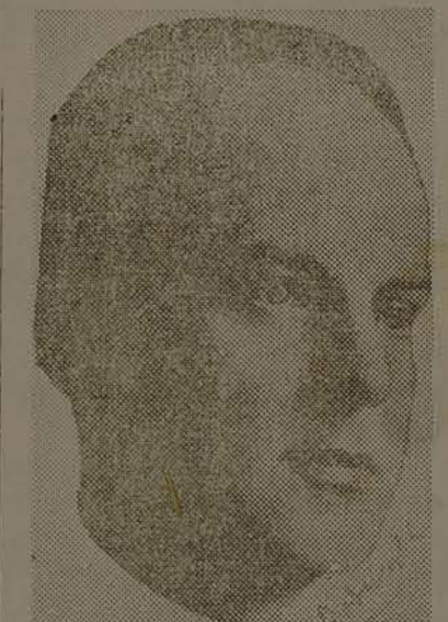
SR. HENRIQUE DODSWORTH

RIO, 25 (Especial) O sr. Henrique Dodsworth, interventor do Distrito Federal, foi denunciado pelo advogado do Partido Libertador Católico, chefiado pelo sr. Pedro Ernesto.