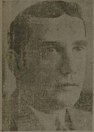
O SR. PEDRO ERNESTO