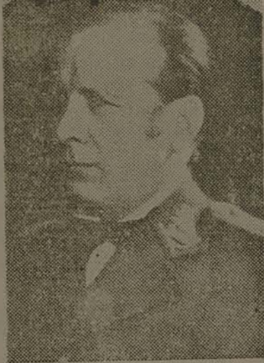
GAL. FLORES DA CUNHA