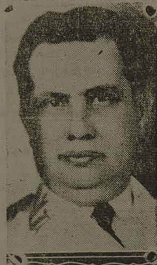
GAL. GO'ES MONTEIRO