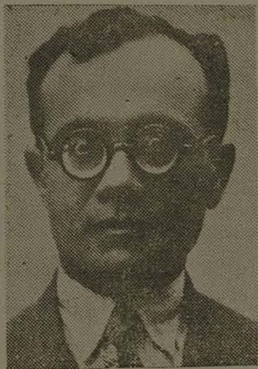
DR. JOSE' AMERICO