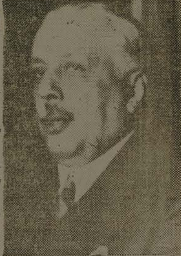
DR. OTAVIO MANGABEIRA

"Onde estariam o ilustre sr. José Americo, e muitos dos que se embaudeiram com a sua candidatura, si o sr. Armando de Sales, o sr. Flores da Cunha e as oposições militantes estivessem com o Catete? Teria, siquer, surgido a candidatura José Americo? Onde estaria ele?"