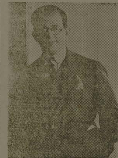
SR. JURACI MAGALHÃES GOVERNADOR DA BAIÁ

RIO, 14 — O governador Juraci Magalhães tem estado em grande atividade politica visitando, hoje, a Camara, onde foi recebido pelo sr. Pedro Aleixo e por todos dos deputados do P.S.D.