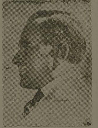
PRESIDENTE GETULIO VARGAS