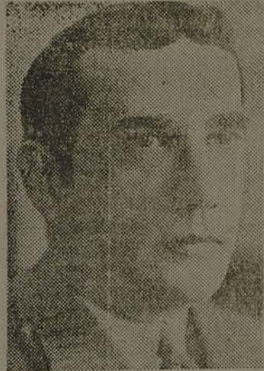
DR. PEDRO ERNESTO

RIO, 14—Tão grande foi a multidão que ocorreu a homenagear o sr. Pedro Ernesto, que somente ás 19 horas chegou a Esplanada do Castelo, o governador da cidade. Esse trajeto em dias comuns é feito por automoveis em 20 minutos.