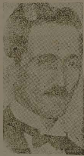
SR. PLINIO SALGADO

RIO, 11 — O sr. Cafe' Filho ocupou a tribuna da Camara, afim de solicitar informações sobre se as autoridades têm conhecimento de estarem os integralistas fazen-