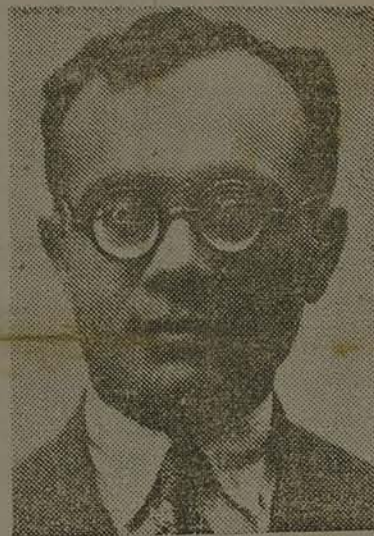
DR. JOSE AMERICO

RIO, 12 — «A Nação» escreve que hoje, á noite, decidirá a sorte da candidatura do sr. José Americo, num conclave que se realizará no Catete, sob a presidencia do sr. Getulio Vargas, e com o comparecimento dos governadores Benedito Valadares, Juraci Magalhães, Lima Cavalcanti e José Malcher, e que exporá ao presidente da Republica a situação difficil em que se encontra, em virtude da ação eleitoral do sr. Magalhães Barata, que discursa fardado, fazendo a propaganda do candidato do oficialismo.