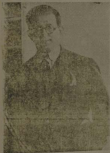
GOVERNADOR JURACI MAGALHÃES

RIO, 13 — (Argos)—O vespertino O POVO estampa sob o título em manchete «Juraci Magalhães—farçante da democracia», extensa reportagem sobre as atividades politico-partidarias do governador da Baía taxando-o de «petulante» e «cínico», além de responsabilis-lo por atos de selvageria praticados contra os adversarios do situacionismo baiano.