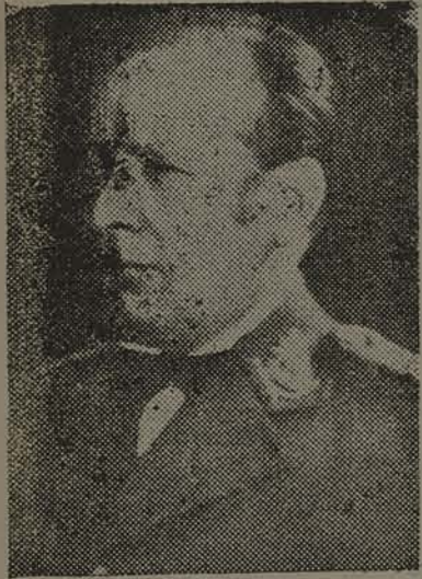
GOVERNADOR FLORES DA CUNHA

RIO, 20 — A «A Nação» publica a seguinte nota: «Acaba de ser apresentada na Assembléa Legislativa do Rio Grande do Sul, uma emenda de lei ao orçamento, que reduz á metade do efetivo da Brigada Militar do Estado. Estamos informados que essa emenda foi sugerida daqui e tem por fim suscitar a rebelião na Força Pública Riograndense, para o efeito de possibilitar a intervenção federal.