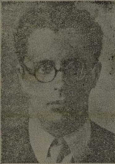
O SR. PEDRO ALEIXO

Hoje, Sua Excia., esteve no Senado e na Camara, onde foi despedir-se dos respectivos presi-