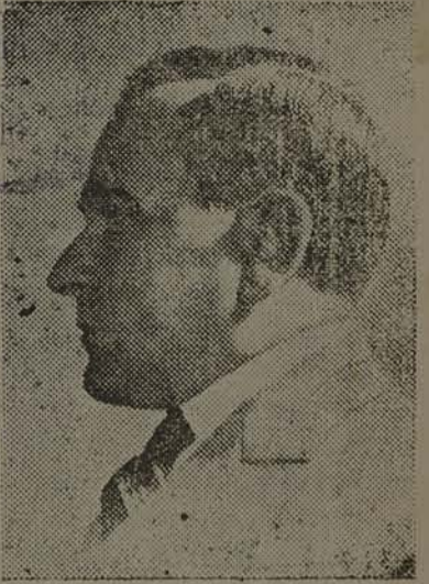
PRESIDENTE GETULIO VARGAS

RIO, 16 (A Gazeta) - O governador desse Estado, dr. Nerêu Ramos, conferenciou, longamente, com o sr. dr. Getulio Vargas, presidente da Republica, na preterita quinta-feira, no último sábado e hoje.