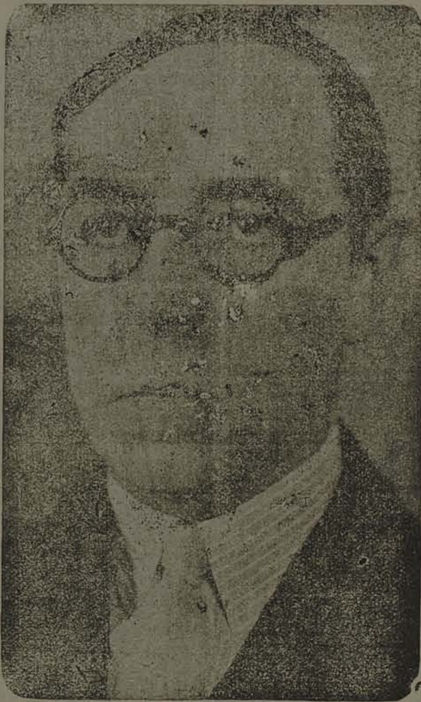
DR. NEREU RAMOS