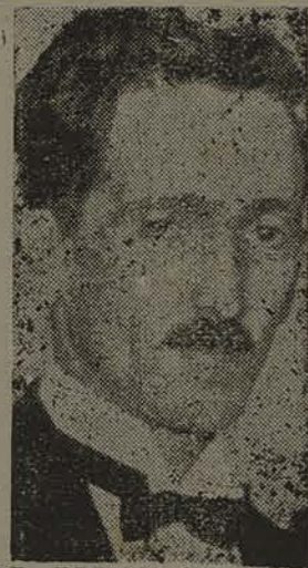
DR. PLINIO SALGADO

Os camisas verdes atacaram desabridamente os candidatos democraticos.--A policia de choque em ação.--A reação da policia na defesa do seu delegado.--70 feridos e 16 mortos