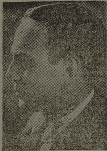
DR. ARMANDO SALES

RIO, (Band) — A União Democratica Brasileira expediu officios a todos os partidos integrados em suas hostes para colaborar na propaganda da candidatura Armando de Sales, indicando alguns nomes de senhoras para formarem o Departamento Feminino de Alistamento Eleitoral. A direção do Departamento Feminino da U. D. B. está entregue á sra. Carlota Pereira de Queiroz. O Partido Libertador Carioca instalou um posto de alistamento para senhoras no Leme, á Rua Salvador Corrêa n. 38. Dentro em breve o Partido Republicano do Distrito Federal também abrirá um posto identico.