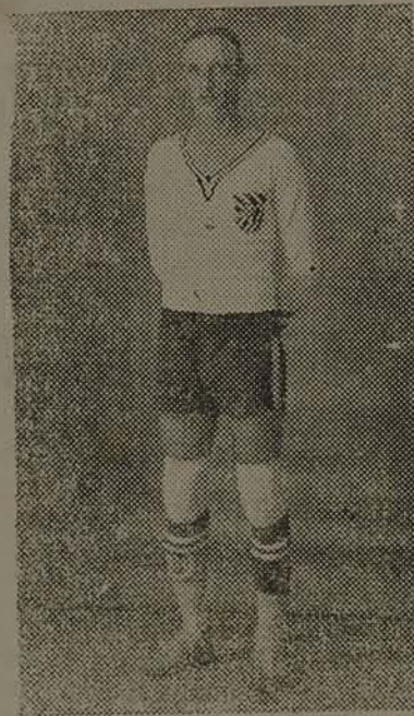
Fredri o excelente zagueiro da L.F.F.

Gato—Boia: Excelentes manejadores da esfera, são dois halves de criterio.