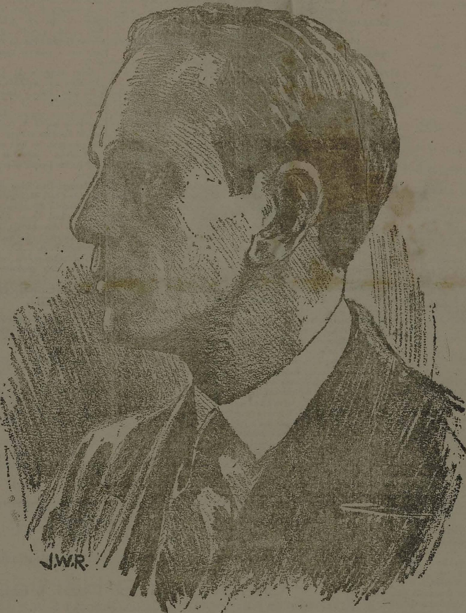
Dr. Armando de Sales Oliveira, candidato nacional á presidencia da Republica

O sr. Armando Sales deverá pronunciar como ficou dito, um