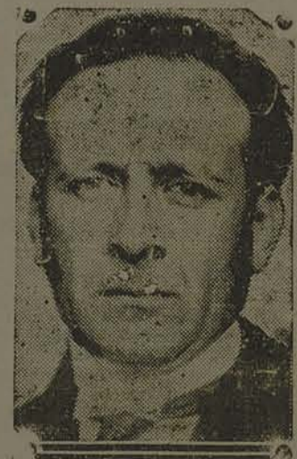
Gel. Flores da Cunha