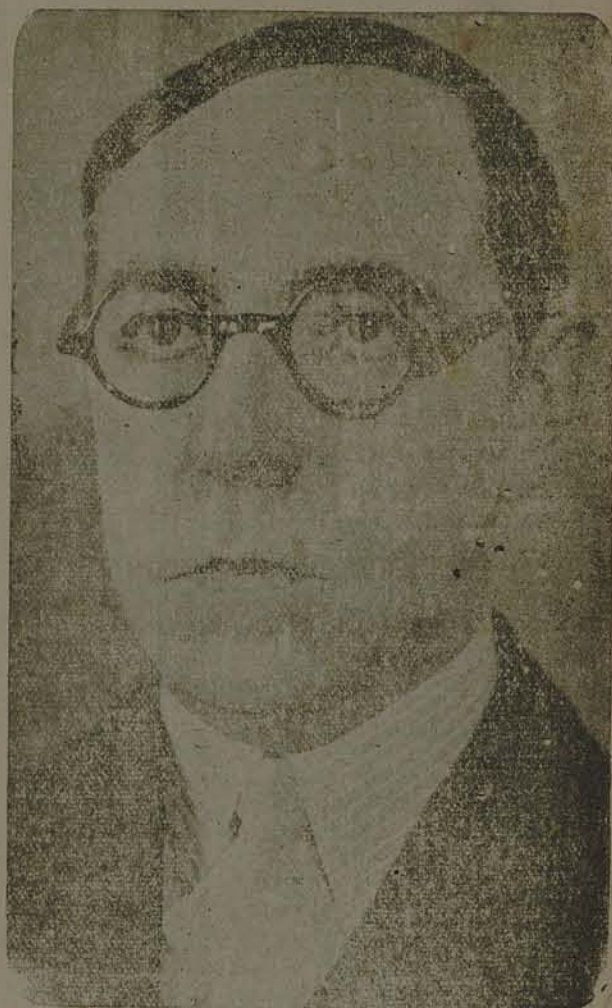
DR. NEREU RAMOS, governador de Estado