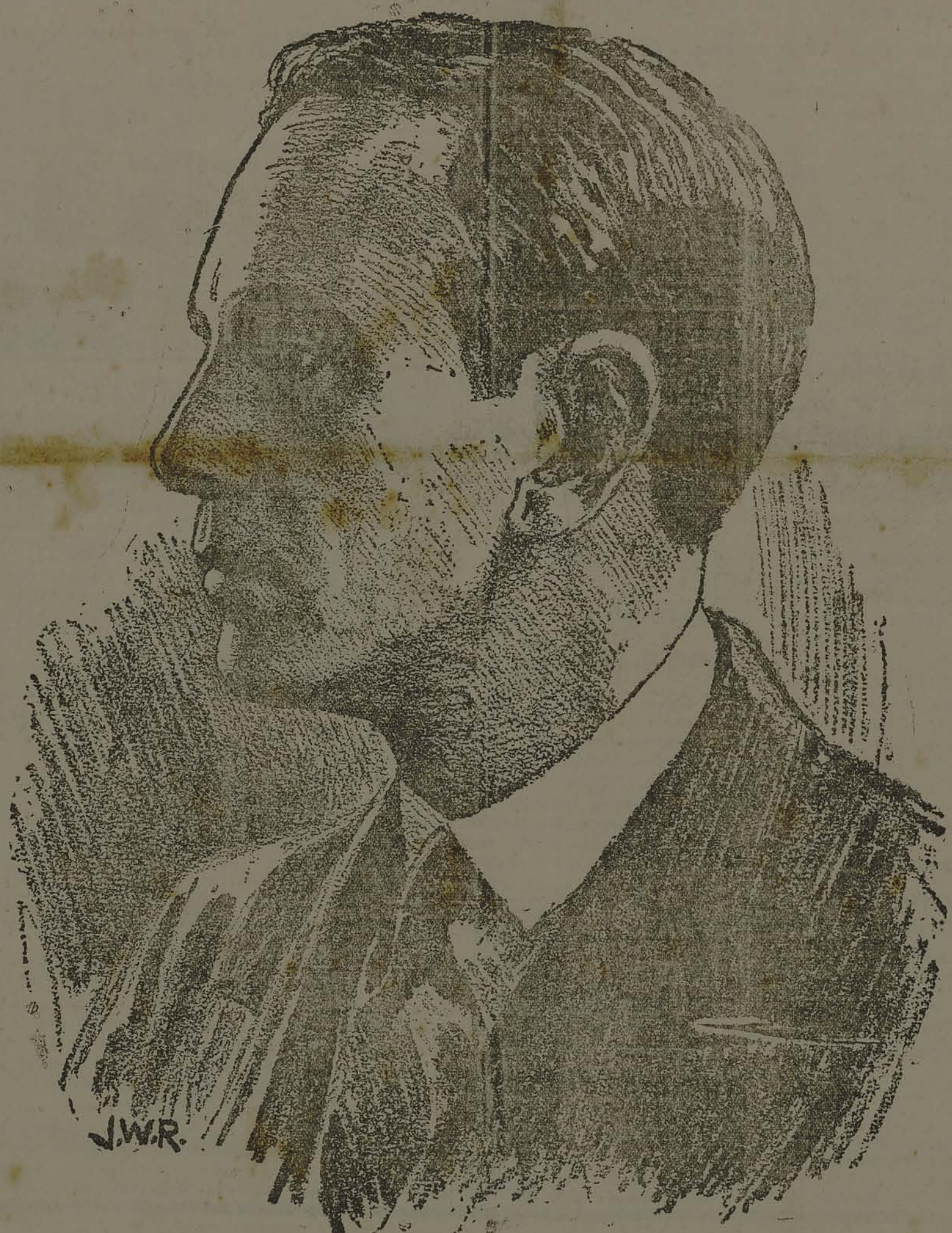
Dr. Armando de Sales Oliveira, candidato do povo brasileiro á presidencia da Republica.