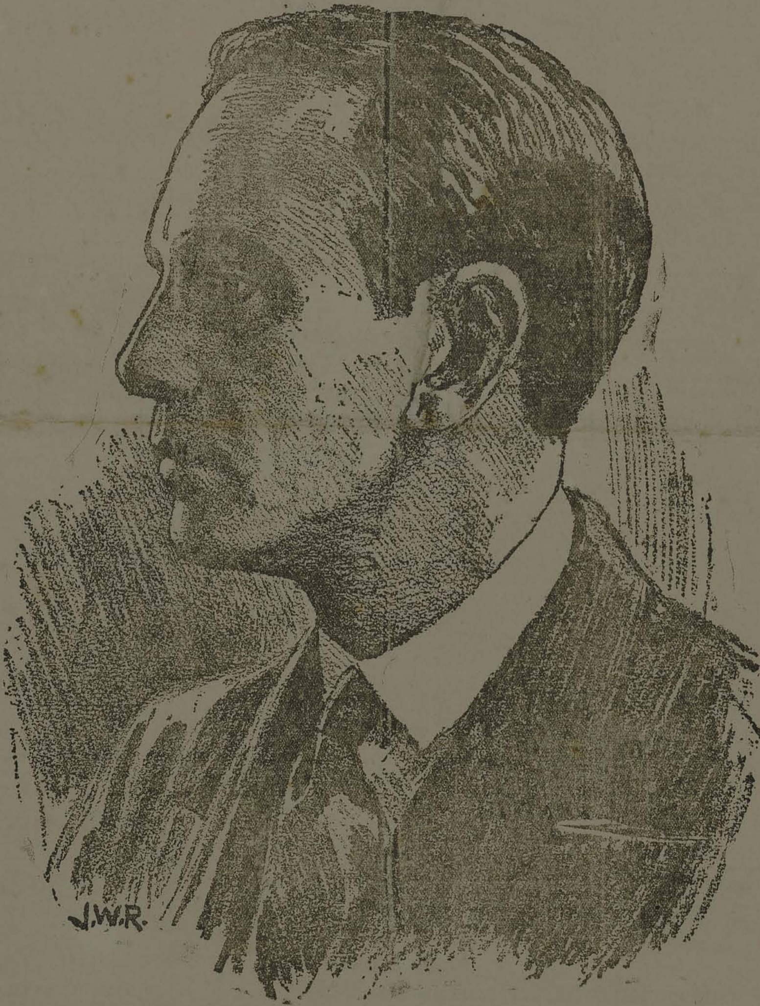
Dr. Armando de Sales Oliveira, candidato do povo brasileiro á presidencia da Republica.