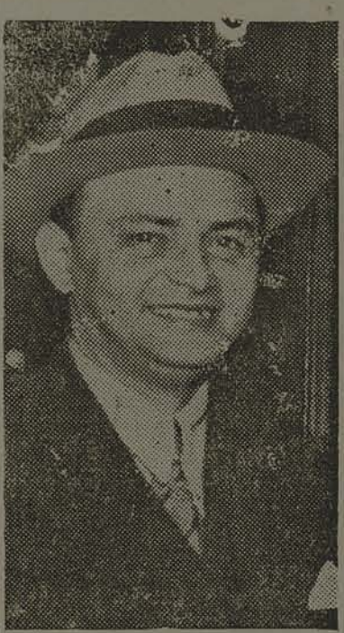
O sr. Agamenon Magalhães