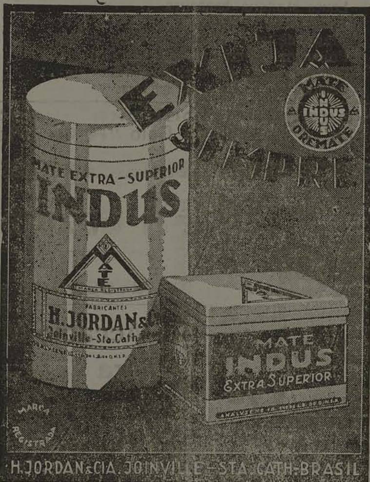
H. JORDAN & CIA. JOINVILLE - STA. CATARINA - BRASIL

ESTA INAUGURAÇÃO ESTÁ SENDO ANCIOSAMENTE ESPERADA