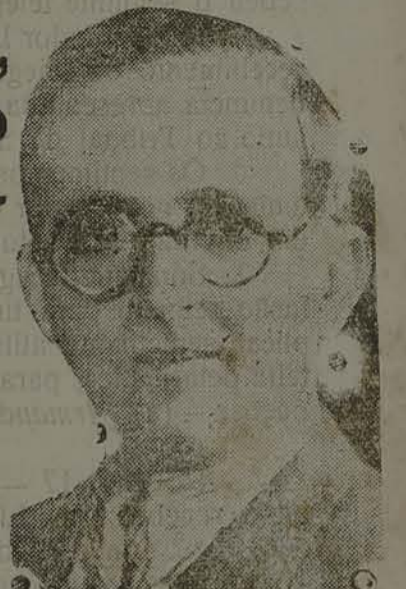
O sr. Juracy Magalhães, governador da Baía