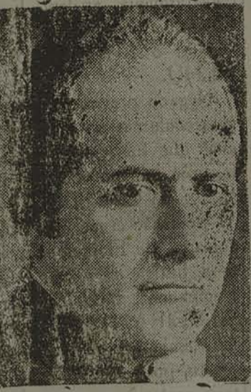
O sr. Lima Cavalcanti, governador de Pernambuco

declararam só participar da Convenção de 25, uma vez afastado do Ministerio da Justiça o sr. Agamenon Magalhães. Este, sabedor do fato, exonerou-se não tendo o presidente Getulio Vargas aceito a demissão.