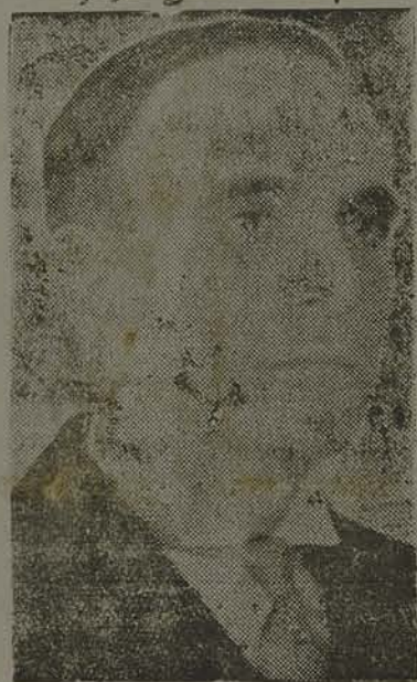
O dr. Armando de Sales