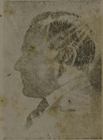
DR. GETULIO VARGAS

dia a dia caracterizando-se pela incidência sucessiva nas várias fases da vida nacional. Os partidos, que se haviam registrados, sob a vigência do Código Eleitoral, estão em sua última fase. E somente se aguarda um decreto do governo declarando in-existent todos esses partidos. Assim passarão definitivamente à história os partidos gaúchos, os catarinenses, os paranaenses, os paulistas, os mineiros, os cariocas e assim por diante.