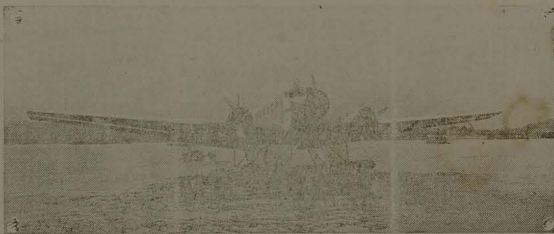
Uma unidade típica da frota aérea da Condor