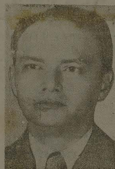
DR. AGAMENON MAGALHÃES