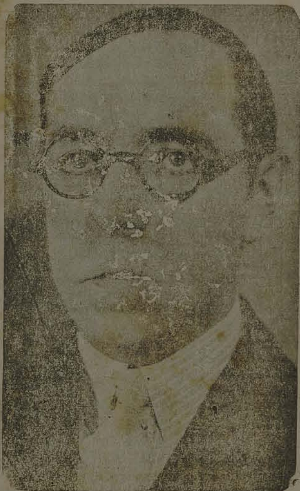
Governador Nerêu Ramos