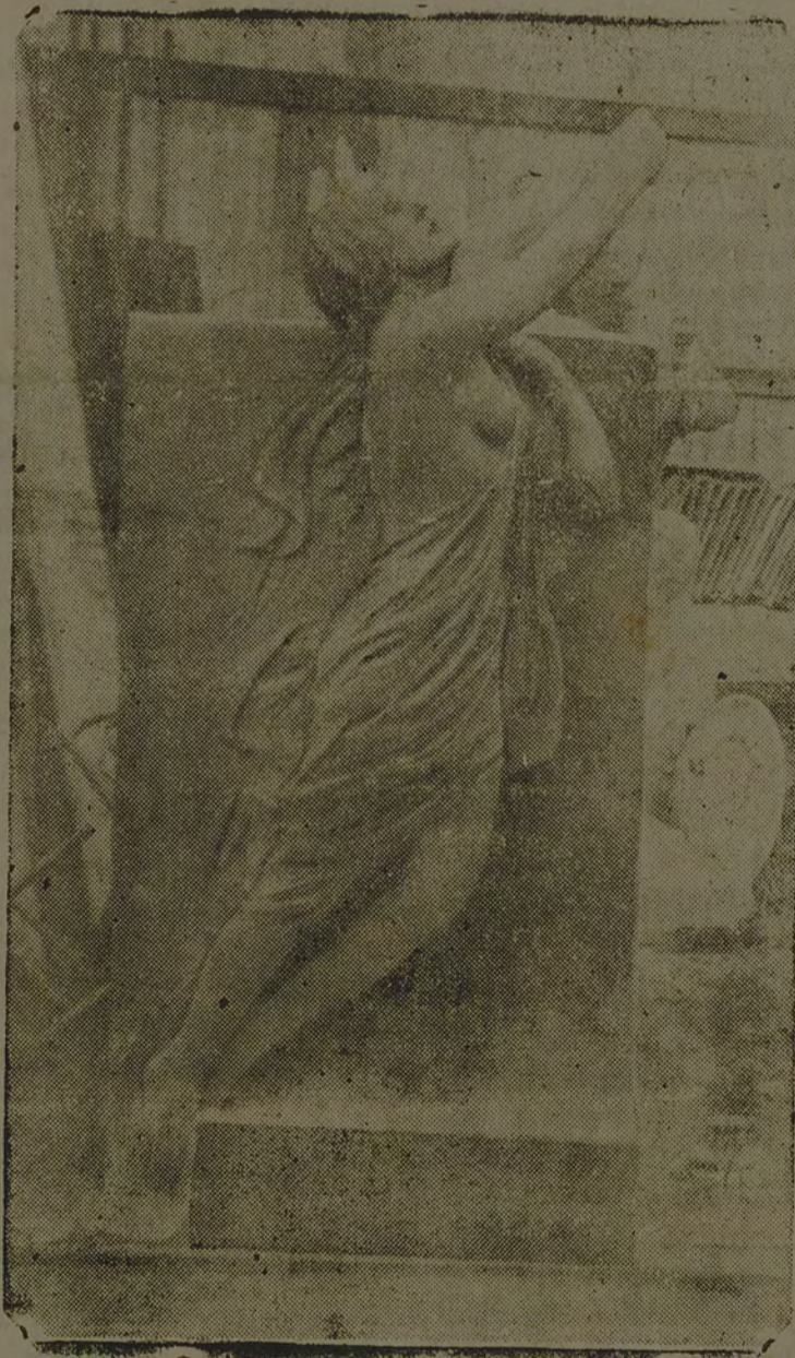
Um detalhe do majestoso monumento a ser erigido

RIO, 18 — Embarcou para Santa Catarina a estatua de bronze do falecido governador Hercilio Luz.