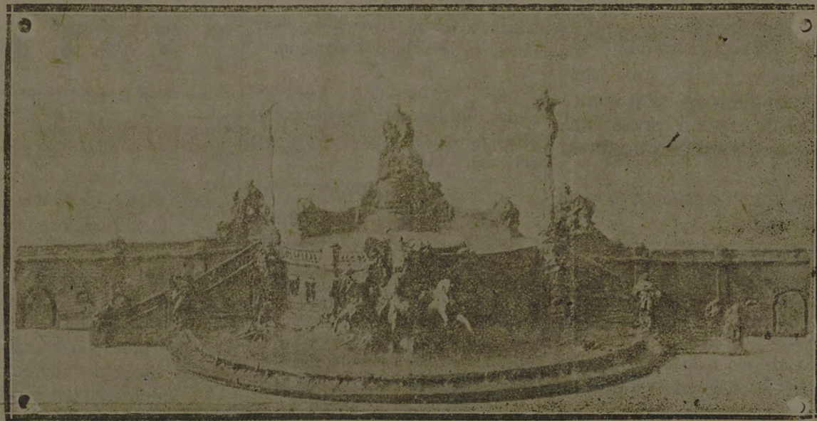
MONUMENTO DE CARLOS GOMES

Em homenagem ao grande músico brasileiro