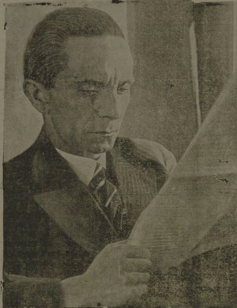
DR. JOSEPH GOEBBELS, Ministro da Propaganda

BERLIM, 11—O ministro Goebbels declarou á United Press que, não parece provavel que o presidente Adolf Hitler convoque o Reichstag antes de 30 do corrente para a comemoração anual da elevação dos nazistas ao poder.